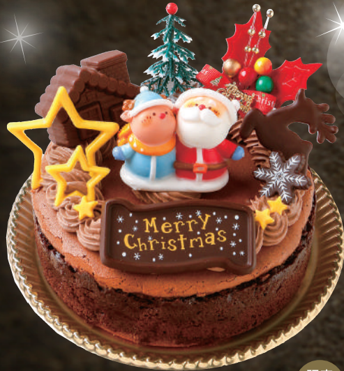
X'mas 蒸し焼きショコラ