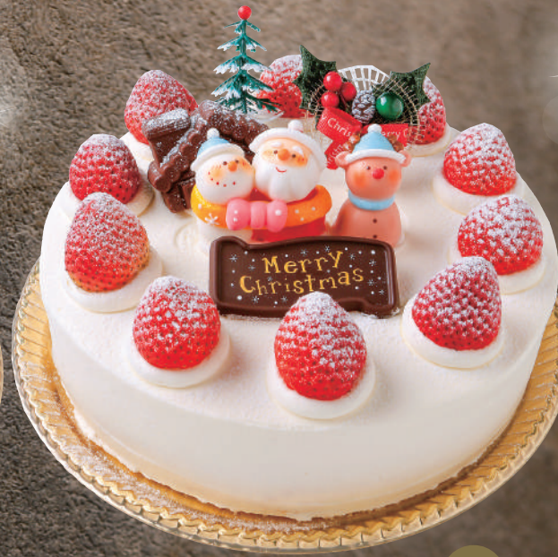
X'mas 生デコレーション