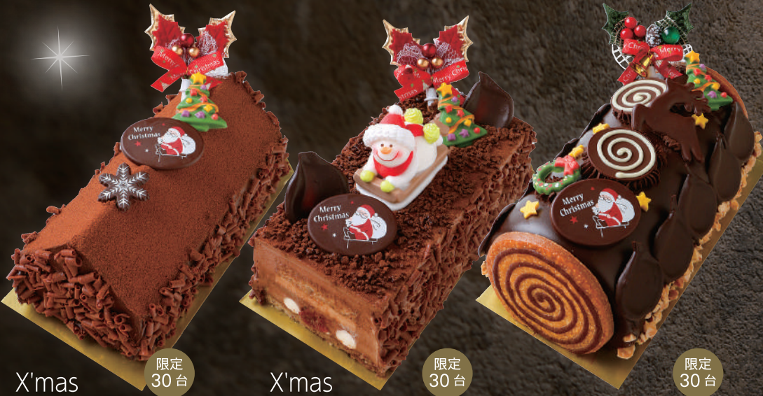
X'mas チョコレートケーキ 限定 30台

約17cm 税込4,968円(本体4,600円) 2種類のフランス産クーベルチュールを使った、シンフォニーナガノ自慢のチョコレートケーキです。