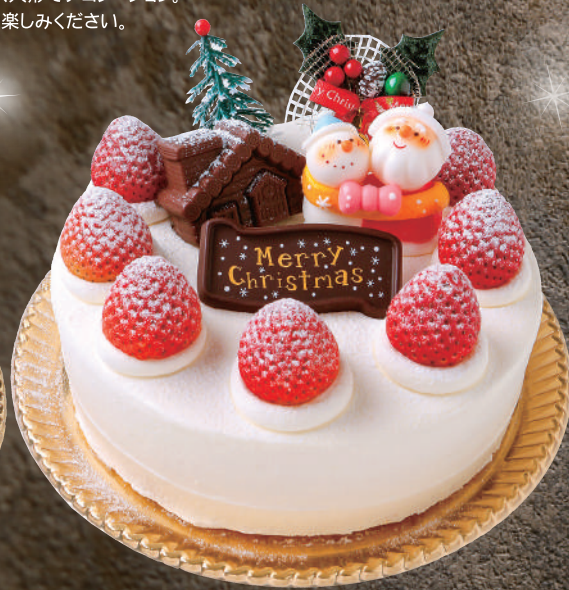
X'mas 生デコレーション