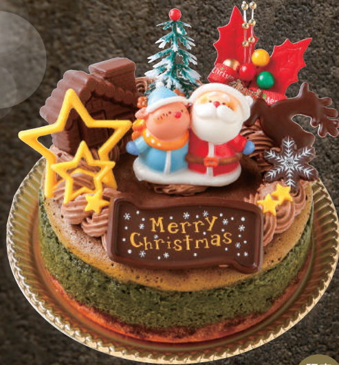
X'mas ガトー抹茶ショコラ