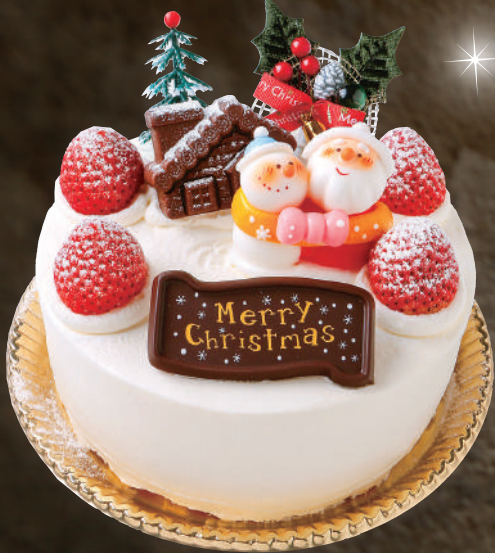
X'mas 生デコレーション

苺、ピーチ、洋梨と生クリームをサンドし、苺とチョコレート、グラス人形でデコレーション。 こだわりのスポンジ生地と生クリームの奥深いハーモニーをお楽しみください。